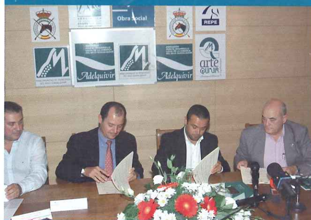
Firma del convenio entre la Real Federación Hípica Española y Adelquivir para homologar las rutas ecuestres.

Además de Adelquivir como socio coordinador, el proyecto de cooperación integra a los grupos de desarrollo rural de Campiña-Los Alcores y Gran Vega (Sevilla), Campiña de Jerez, Litoral de la Janda y Costa Noroeste (Cádiz), Mendinet (Euskadi), la asociación Ceder-na-Garalur de la Montaña de Navarra y, ya fuera de España, Felső-Homokhátság Videkjlesztési Egyesület (Hungría), Adrepes (Portugal) y el Pays d'Argentan Pays d'Auge Ornais y el Conseil Des Chevaux de Basse Normandie (Francia).